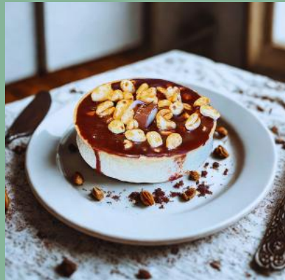
TARDALETKA KINDER COUNTRY