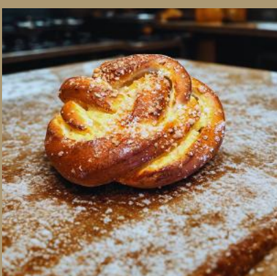
DROŻDZÓWKA KRĘCONA Z SEREM