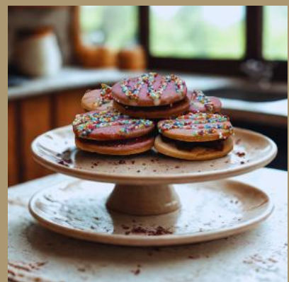
KRUCHE Z POWIDŁEM ŚLIWKOWYM