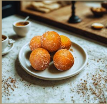
KULE SEROWE NA SŁODKO