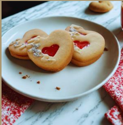
KRUCHE SERCA Z ŻELKĄ