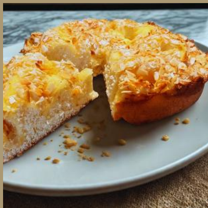
PLACEK DROŹDZOWY MAŚLANY - MAMA CAKE