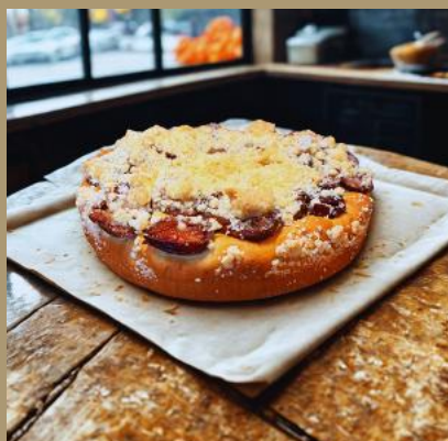
PLACEK DROŹDZOWY ZE ŚLIWKAMI