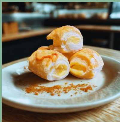
GRZEBYKI PÓLFRANCUSKIE Z SEREM