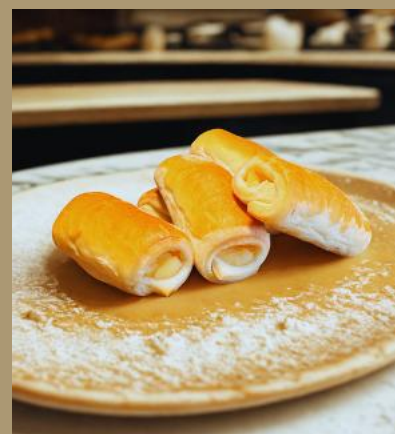
PALUSZKI DROŻDŻOWE Z SEREM