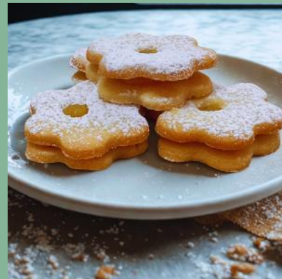
KWIATEK Z MARMOLADĄ MORELOWĄ