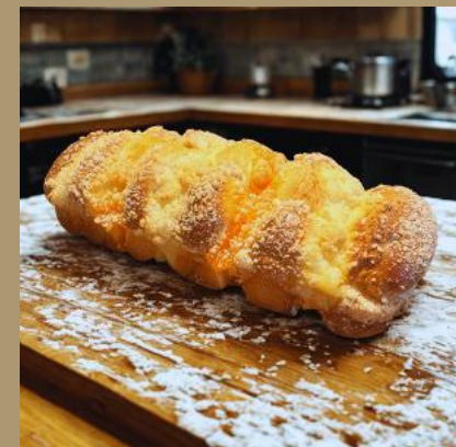
PLACEK DROŹDZOWY Z MORELĄ I SEREM