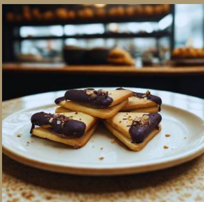
KRUCHY TRÓJKĄT CAPPUCINO Z POLEWĄ CZEKOLADOWĄ