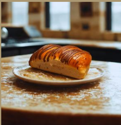
PALUCH MAŚLANY Z ADVOCATEM