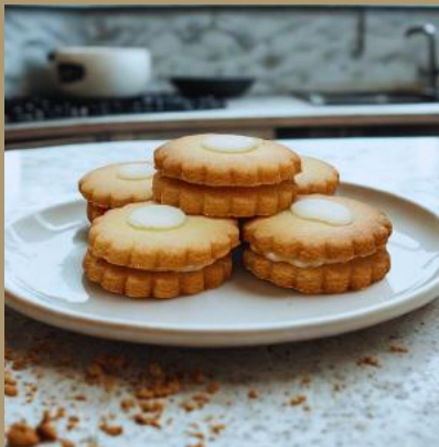
MARKIZA Z BIAŁĄ CZEKOLADĄ