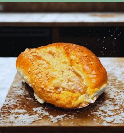
DROŹDZÓWKA Z JABŁKIEM