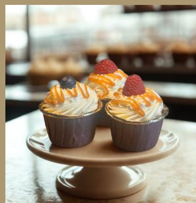
MINI SERNICZKI KRÓWKOWE