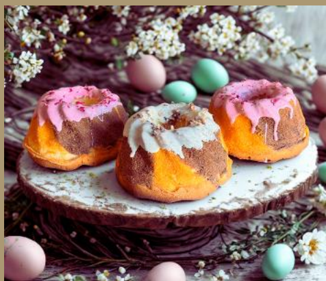
BABKI PIASKOWE MARMURKOWE