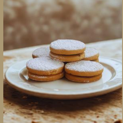
KRUCHE Z CZEKOLADĄ I PUDREM