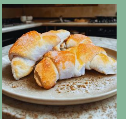
ROGAL DROŻDZOWY Z MARMOLADĄ