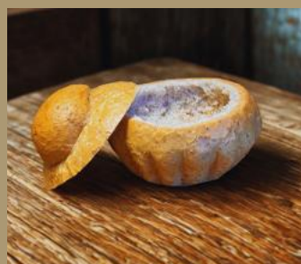
KUBEK GRAHAM NA ŻUREK