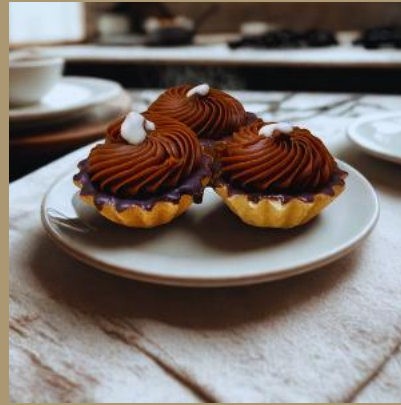
MINI BABECZKA Z KAJMAKIEM