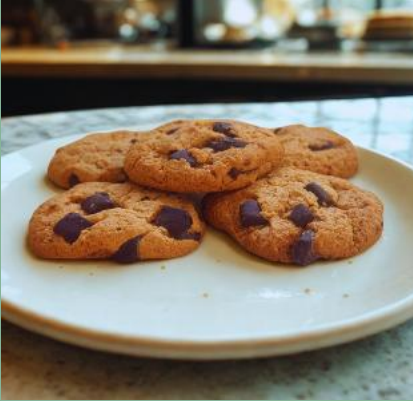
PIEGUSKI Z CZEKOLADĄ