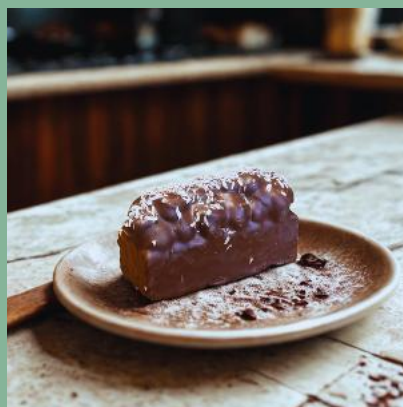
BATON CZEKOLADOWY Z KOKOSEM