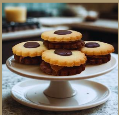
ROZETKA Z MASĄ CZEKOLADOWĄ