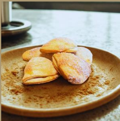
CIASTECZKA KRUCHE Z JABŁKAMI