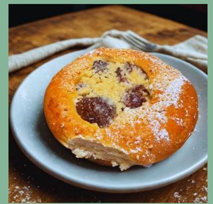
DROŹDZÓWKA ZE ŚLIWKAMI