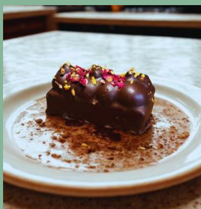
BATON CZEKOLADOWY Z KREMEM PISTACJOWYM