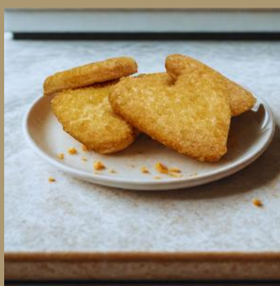
SERCE Z CUKREM