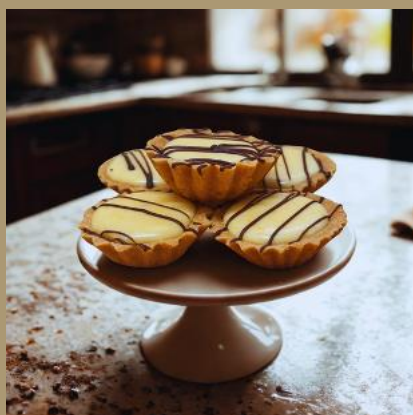
MINI BABECZKA WANILIOWA