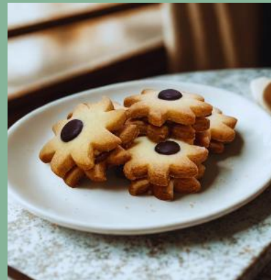
GWIAZDKI Z KAJMAKIEM