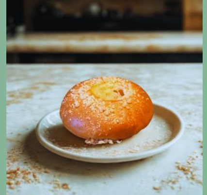
DROŹDZÓWKA MAŚLANA MAŁA Z MORELĄ