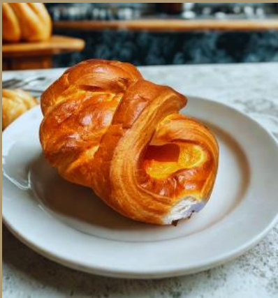
DROŻDZÓWKA FRANCUSKA Z NADZIENIEM MORELOWYM