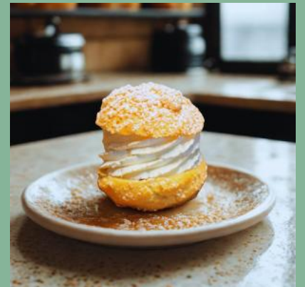
PTYŚ ZE ŚMIETANĄ I PORZECZKĄ