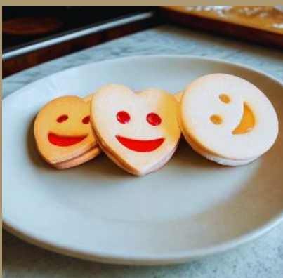
KRUCHE Z ŻELKĄ OWOCOWĄ