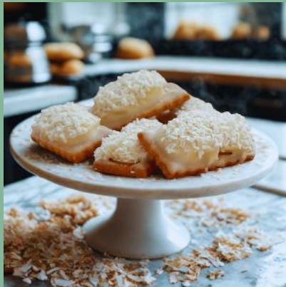
PRINCESKA W BIAŁEJ CZEKOLADZIE Z NADZIENIEM KOKOSOWYM