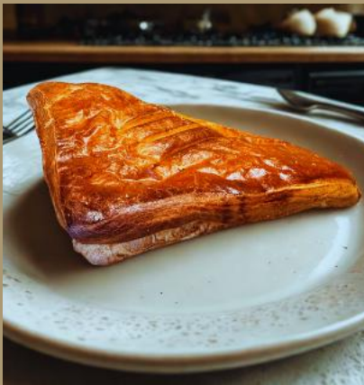
DROŻDZÓWKA FRANCUSKA Z NADZIENIEM WIŚNIOWYM