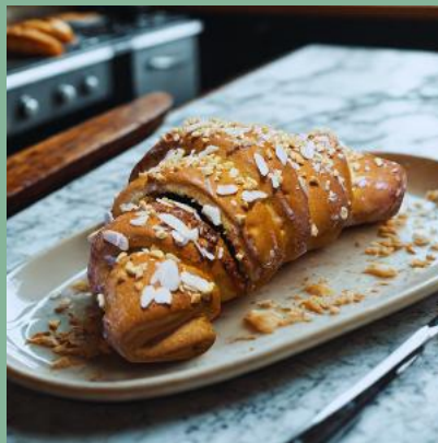
ROGAL Z BIAŁYM MAKIEM