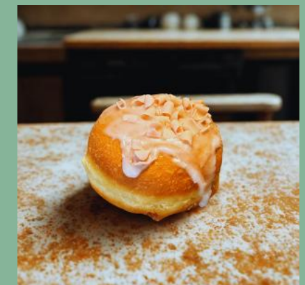
PĄCZEK Z BIAŁĄ CZEKOLADĄ I RÓŻĄ