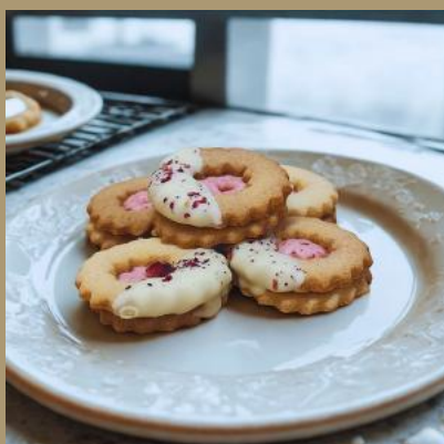
ROZETKA TRUSKAWKOWA Z BIAŁĄ POLEWĄ