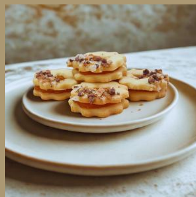
ROZETKA Z MARMOLADĄ POMARAŃCZOWĄ