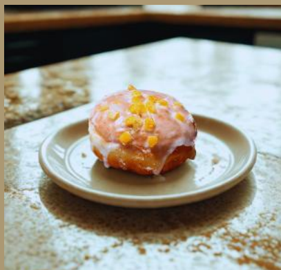
PĄCZEK LUKROWANY Z MARMOLADĄ I SKÓRKĄ POMARAŃCZY