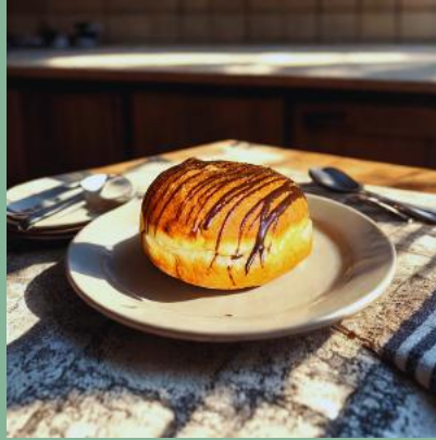
PĄCZEK Z NUTELLA