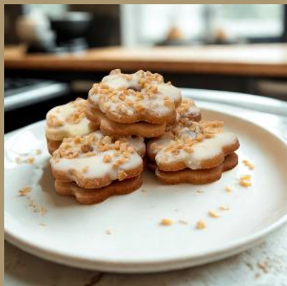
ROZETKA Z NADZIENIEM CZEKOLADOWYM I POLEWĄ