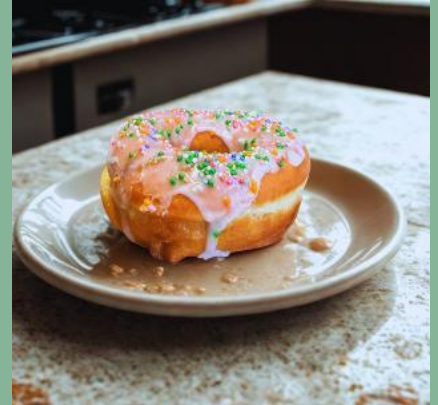
OPONKA Z LUKREM