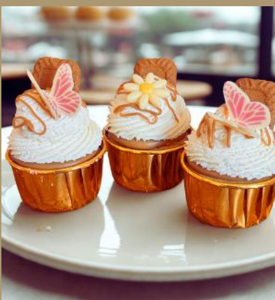
MINI SERNICZKI LOTUS