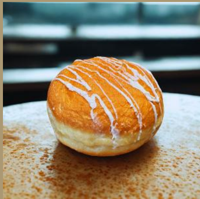
PĄCZEK KINDER BUENO