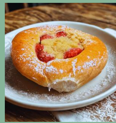
DROŹDZÓWKA Z TRUSKAWKAMI