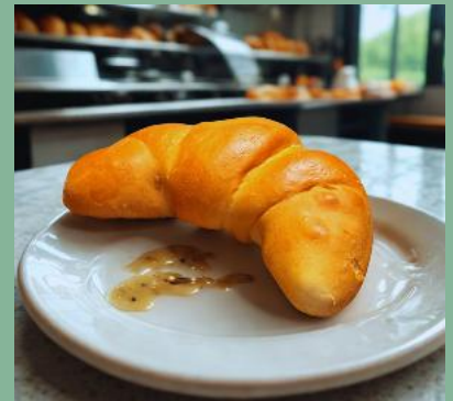
ROŻEK PÓLKRUCHY Z CZEKOŁADĄ I MARMOLADĄ