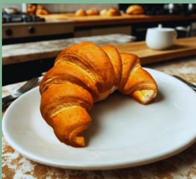
FRANCUSKI ROŻEK NUTELLA