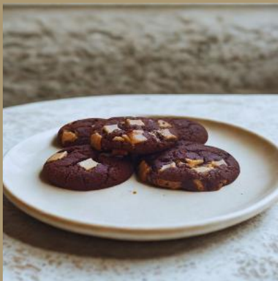
CIEMNE PIEGUSKI Z BIAŁĄ CZEKOLADĄ