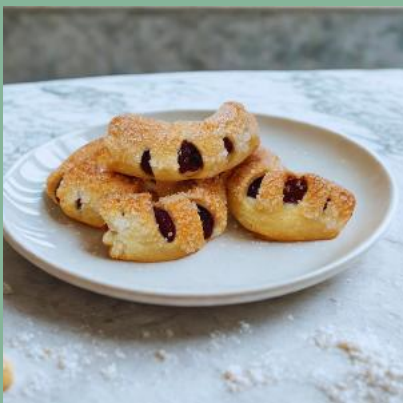
ROGAL Z CUKREM I MARMOLADĄ