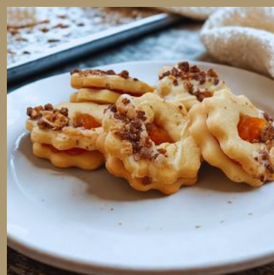
ROZETKA Z NADZIENIEM MORELOWYM