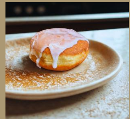
PĄCZEK LUKROWANY Z MARMOLADĄ