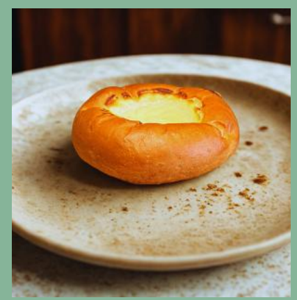
DROŹDZÓWKA Z SEREM