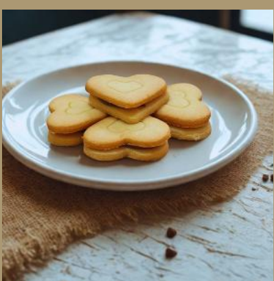
SERCE Z CZEKOLADĄ I CHRUPKAMI