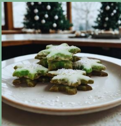
GWIAZDKI Z BIAŁĄ CZEKOLADĄ I CHRUPKĄ