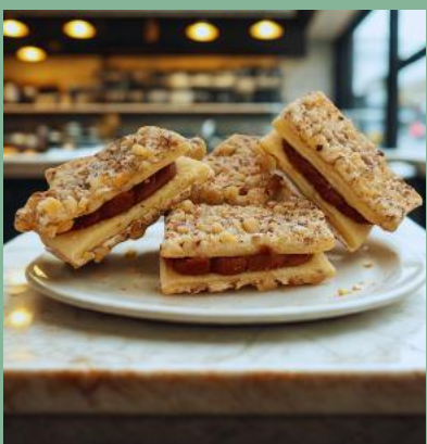
LUKIERKI ORZECHOWE Z NADZIENIEM KAJMAKOWYM