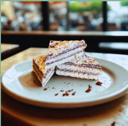
Z BIAŁĄ CZEKOLADĄ I CHRUPKĄ