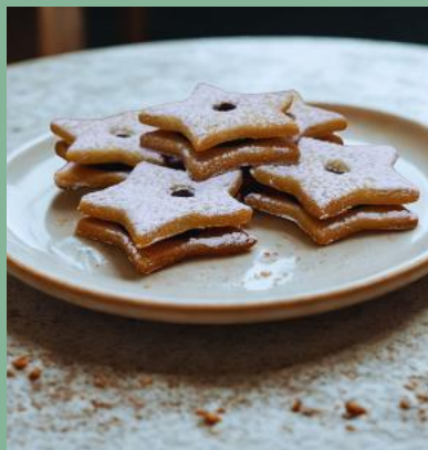
GWIAZDKI Z MARMOLADĄ