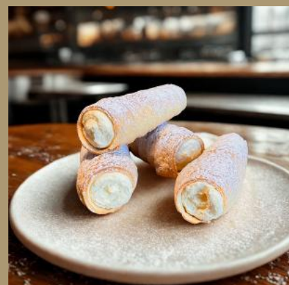
RURKI Z KREMEM