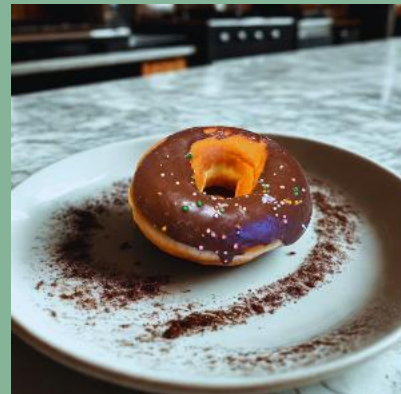
OPONKA Z POLEWĄ CZEKOLADOWĄ