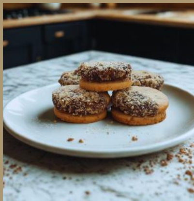
KRUCHE Z MARMOLADĄ I POLEWĄ CZEKOLADOWĄ