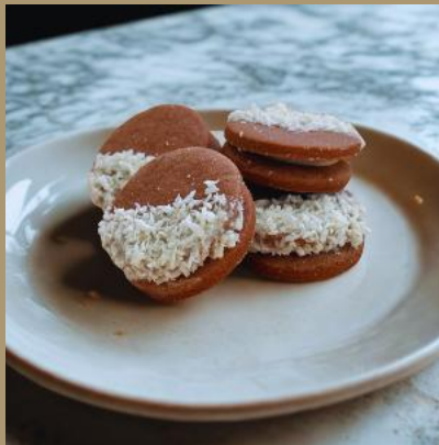
MARKIZA CZEKOLADOWA Z KOKOSEM