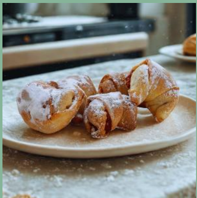
ROGAL Z MARMOLADĄ I PUDREM