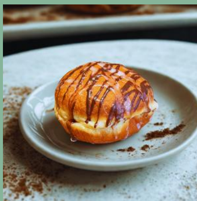
PĄCZEK Z ADWOKATEM