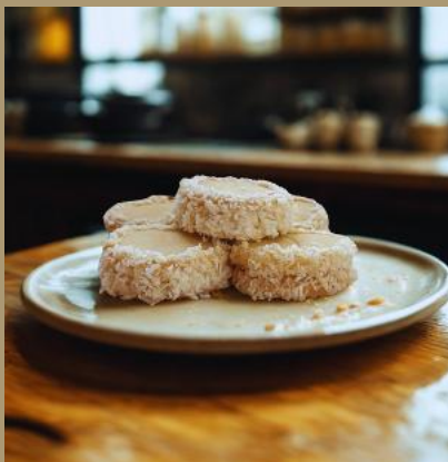
KRUCHE Z KOKOSEM I BIAŁĄ CZEKOLADĄ