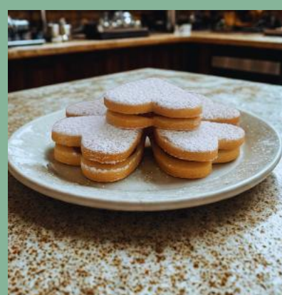
KRUCHE SERCA Z MARMOLADĄ I PUDREM