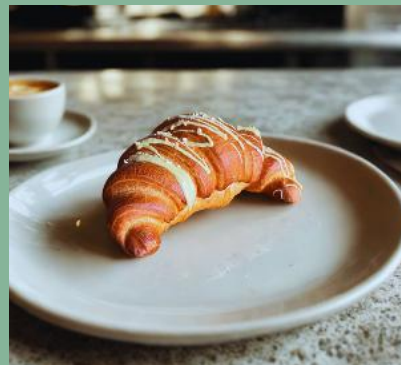
FRANCUSKI ROŻEK PISTACJA