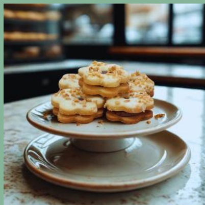
KWIATEK Z NADZIENIEM CZEKOLADOWYM I POLEWĄ Z POSYPKĄ