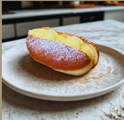
PĄCZEK Z BUDYNIEM