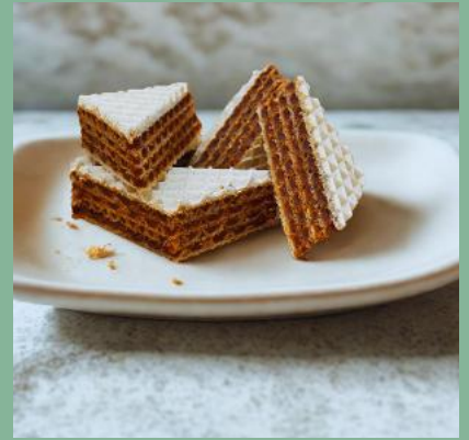
PISZINGER Z KARMELEM