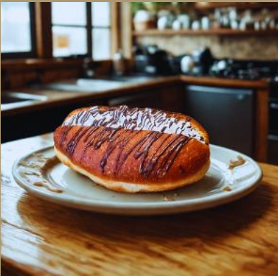
PĄCZEK Z BITĄ ŚMIETANĄ