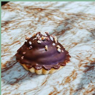
BABECZKA KINDER BUENO