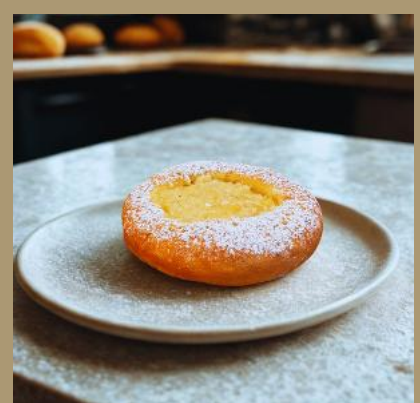
DROŻDZÓWKA MAŁA Z JABŁKIEM