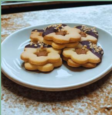
KWIATEK SŁONY KARAMEL Z POLEWĄ CZEKOLADOWĄ