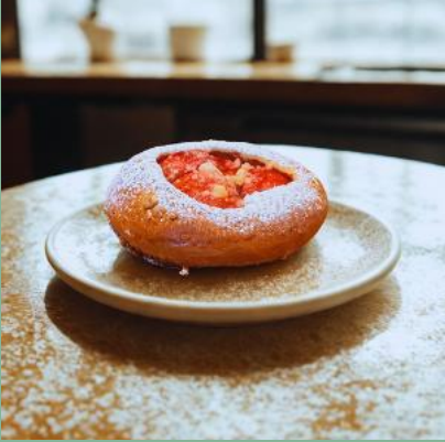
DROŹDZÓWKA MAŁA Z TRUSKAWKĄ