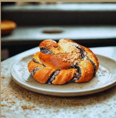
DROŻDZÓWKA KRĘCONA Z MAKIEM