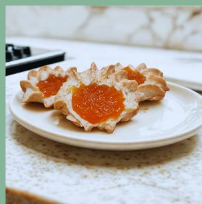
KOSANKA Z NADZIENIEM MORELOWYM