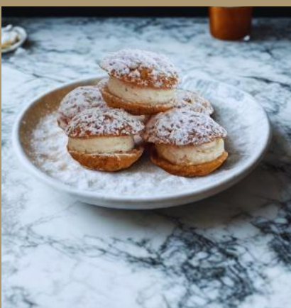
ORZESZKI Z KREMEM