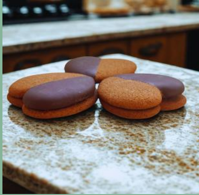
PIERNIKOWE SERCE Z POWIDŁAMI