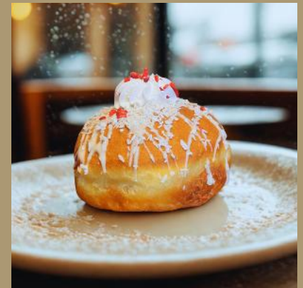
PĄCZEK Z KOKOSEM I MALINOWYM NADZIENIEM