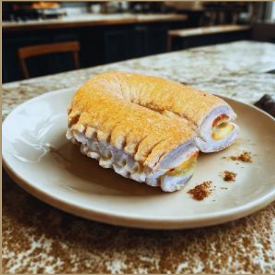
DROŻDZÓWKA FRANCUSKA Z NADZIENIEM SEROWYM