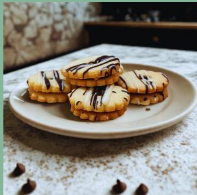
KWIATEK Z MARMOLADĄ