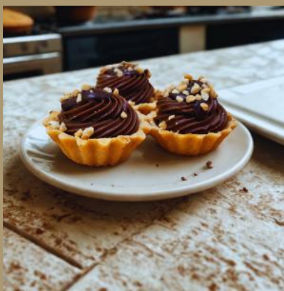
MINI BABECZKA ORZECHOWA