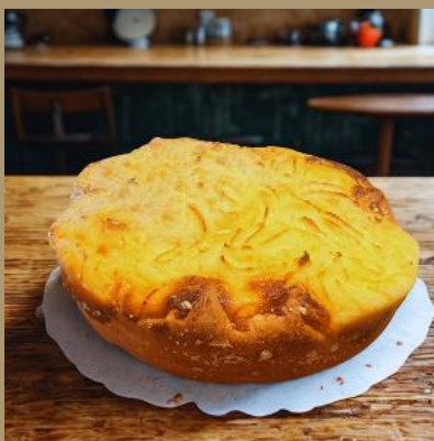
PLACEK DROŹDZOWY Z SEREM