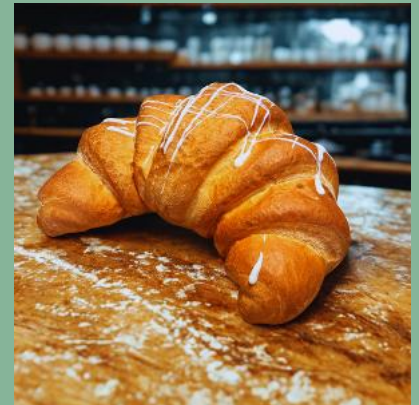
FRANCUSKI ROŻEK KINDER BUENO