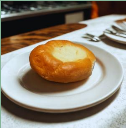
DROŹDZÓWKA MAŁA Z SEREM