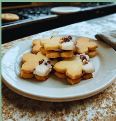
KWIATEK Z NADZIENIEM CZEKOLADOWYM