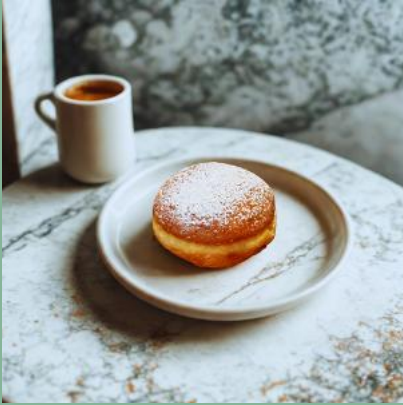
PĄCZEK MINI Z MARMOLADĄ PUDROWANY