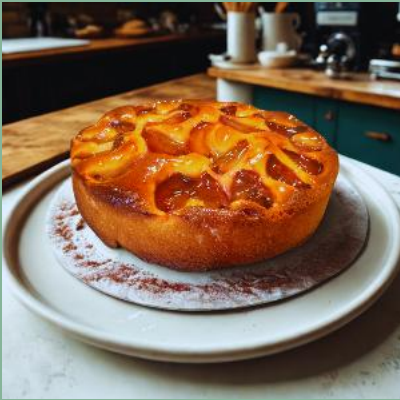
PLACEK JOGURTOWY ZE ŚLIWKAMI Z GLAZURĄ