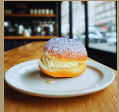
PĄCZEK Z SEREM