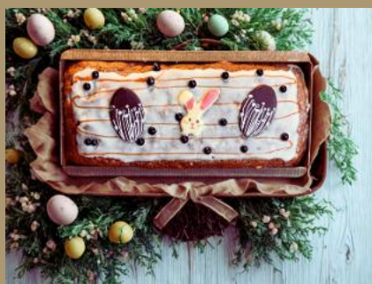
CIASTO MARCHEWKOWE DEKOROWANE