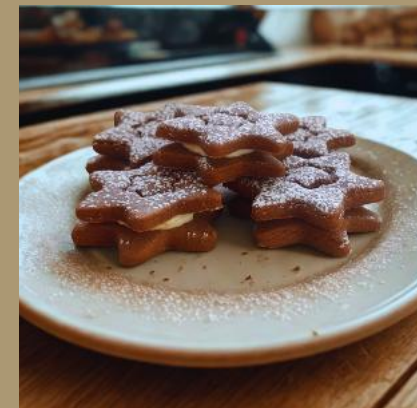
CIEMNE GWIAZDKI Z BIAŁĄ CZEKOLADĄ