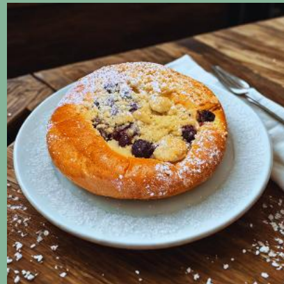
DROŹDZÓWKA Z JAGODAMI