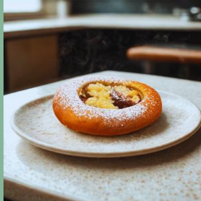
DROŹDZÓWKA MAŁA ZE ŚLIWKĄ