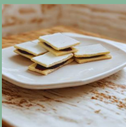
LUKIERKI Z POWIDŁAMI