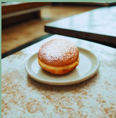
PĄCZEK Z MARMOLADĄ PUDROWANY