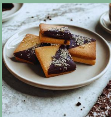
KOSTKA Z NADZIENIEM CZEKOLADOWYM