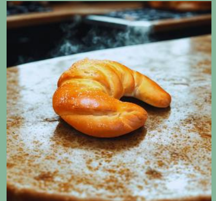
ROGAL MAŚLANY Z KRUSZONKĄ