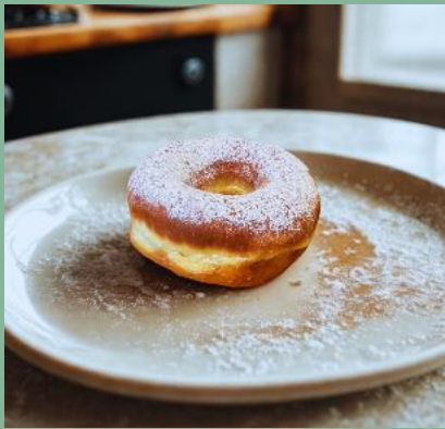
OPONKA Z PUDROWANY