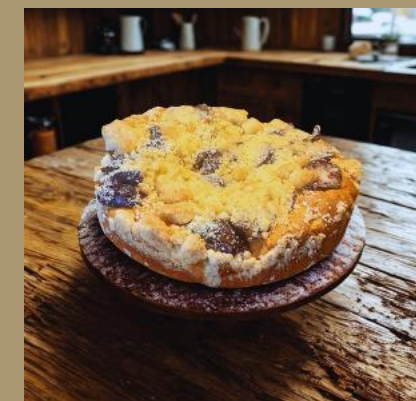
PLACEK JOGURTOWY ZE ŚLIWKAMI I KRUSZONKĄ