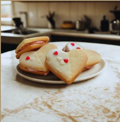
KRUCHE SERCA Z MASĄ TRUSKAWKOWĄ