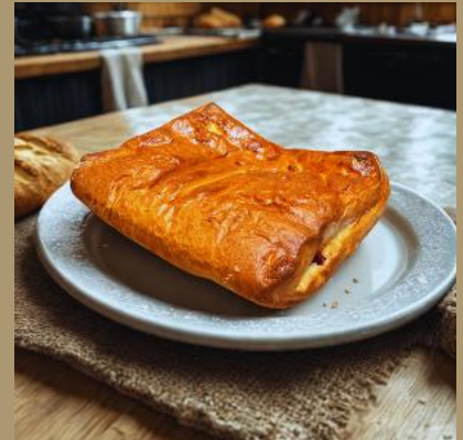
DROŻDZÓWKA FRANCUSKA Z NADZIENIEM JAGODOWYM